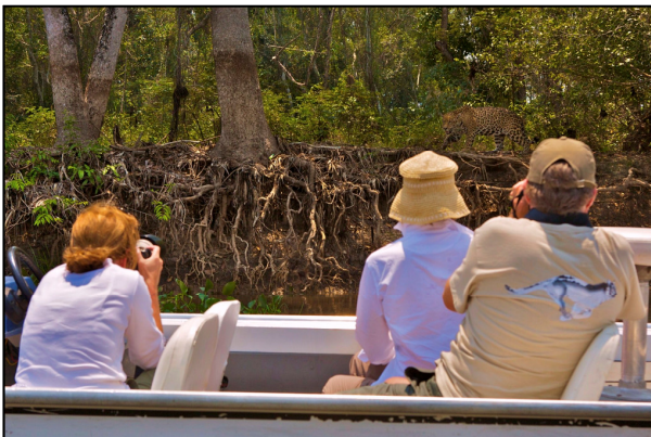
Figura 1. Turistas observando uma onça-pintada ( Panthera onca ) na região do Porto Jofre, Poconé, Mato Grosso.